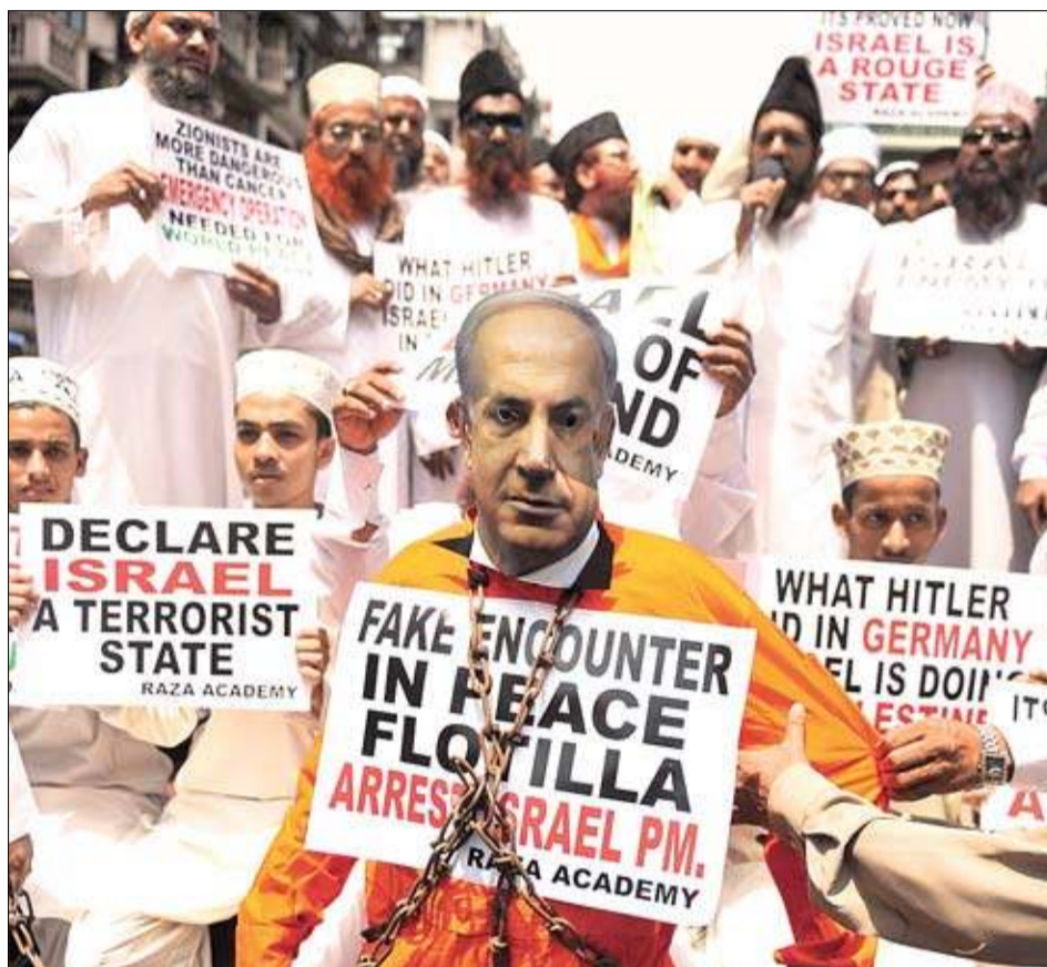
Un grupo de musulmanes árabes se manifiesta contra la política de Israel.

Por supuesto, todos acusan de esta situación a Israel que, con el apoyo de Egipto, impuso el bloqueo sobre Gaza cuando el movimiento islamista Hamás se hizo con el control de la franja en 2007.